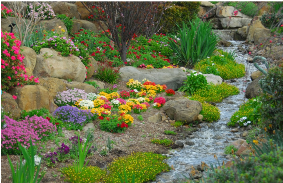
Ogród skalny https://www.youtube.com/watch?v=aLuBB2wLrIY

https://www.youtube.com/watch?v=KHSFCjoXY0