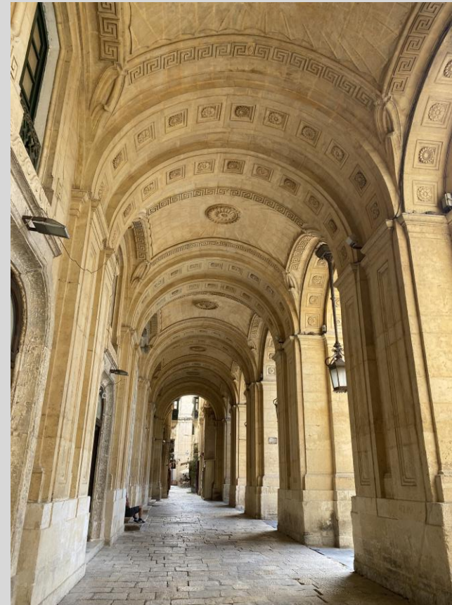
Wejście do Biblioteki Narodowej Malty