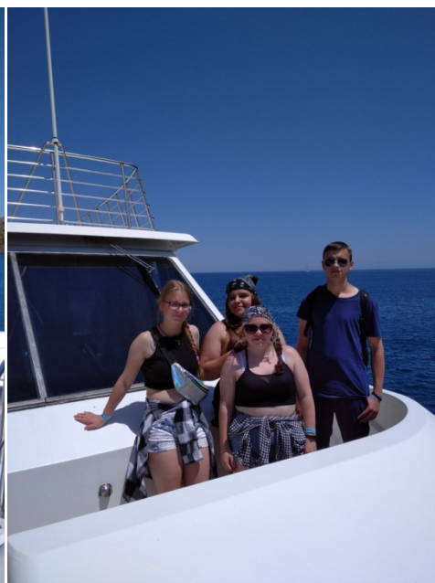
Millazzo i okolice