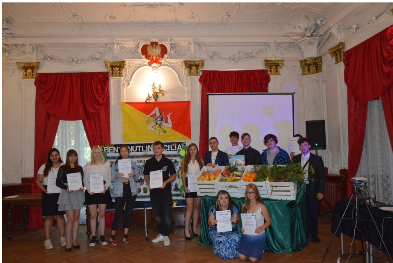
Itowa – Milazzo 07.05. – 01.06. 2022 r.