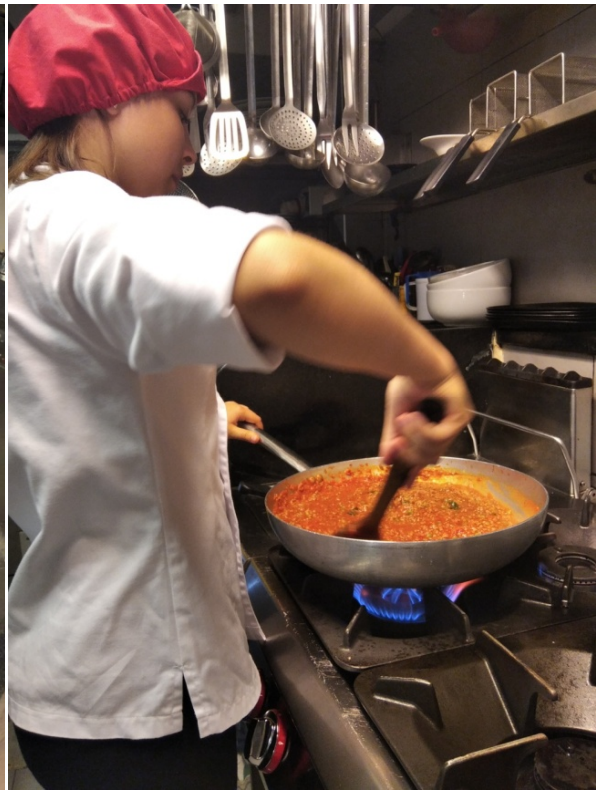
Firma: Ngonia bay Tono