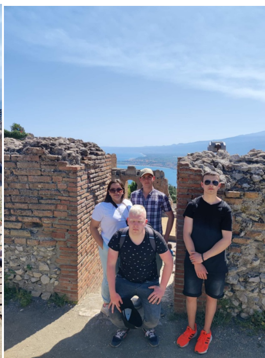
Wycieczka statkiemna wyspy Liparyjskie: 22.05.2022 r.