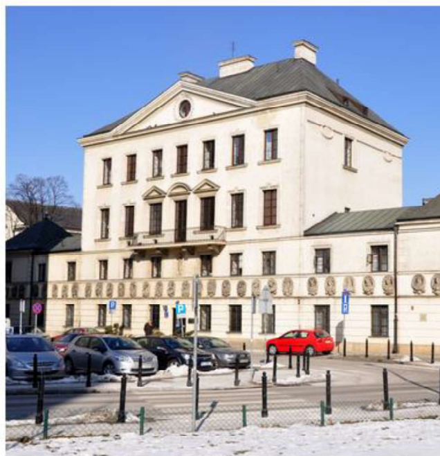
W tym warszawskim budynku mieściła się pierwsza polska biblioteka publiczna 2011, licencja: CC BY 3.0

W 1747 roku bracia Józef (1702–1774) i Andrzej (1695–1758) Załuscy – arystokraci, mecenas sztuki i organizatorzy życia intelektualnego – powołali do życia pierwszą w Polsce i jedną z pierwszych w Europie bibliotekę publiczną. Zgromadzili w niej około 400 tysięcy różnorodnych druków i niemal 20 tysięcy rękopisów. Biblioteka nie tylko je udostępniała (od pewnego momentu tylko na miejscu, bo sporo dzieł nie zostało zwróconych), ale również opracowywała. Była to więc instytucja naukowa, która katalogowała i opracowywała już posiadane książki i rękopisy, a także inicjowała działalność polegającą na pisaniu kolejnych dzieł (np. historycznych),