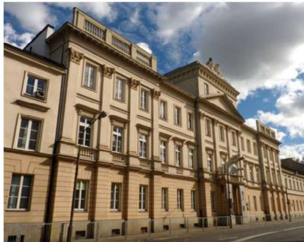
Budynek, w którym mieściła się szkoła pijarów Collegium Nobilium.

W 1765 roku powstała pierwsza szkoła kadetów, zwana Szkołą Rycerską. Założył ją król Stanisław August (przeznaczył na ten cel z własnych funduszy 1,5 miliona złotych), a komendantem został książę Adam Kazimierz Czartoryski.