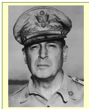
gen. Douglas MacArthur