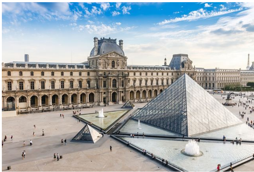
budynek Luwr w Paryżu

W Paryżu - stolicy Francji znajduje się najbardziej znane muzeum na świecie - Luwr . Początkowo było jedynie twierdzą obronną. Dziś stanowi muzeum z ponad 350 tysiącami eksponatów.