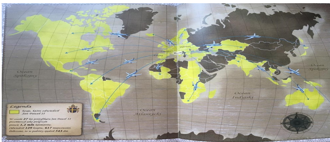
Podróż do Afryki

https://www.youtube.com/watch?v=A2DHSIV_OWE